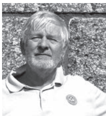
AF SVEIN BØHN

Den lange hovedfagstime ved skoledagens begyndelse er et særkende for Steinerskolen. At disse timer også hænger sammen i perioder på 2–5 uger med samme faglige tema, bidrager yderligere til at styrke det kontinuerlige, samlende i undervisningen.